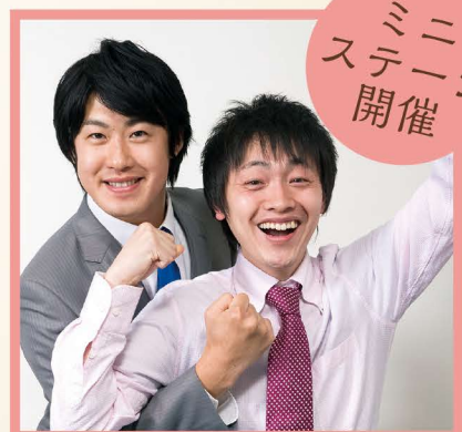
ナビゲーター：あどぼる〜ん