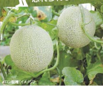
メロン収穫(イメージ)