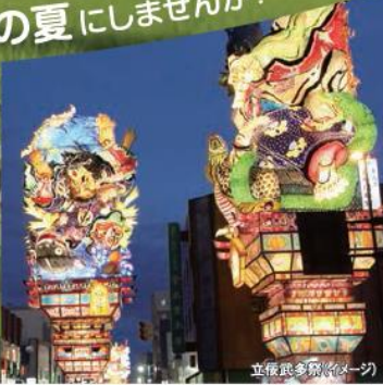
立役武多祭(イメージ)