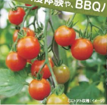
ミニトマト収穫(イメージ)