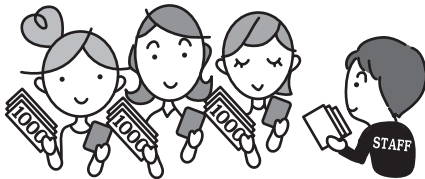
本部は鍛冶町サカモト薬局さんの裏だよ!

参加チームは当日18時30分までに本部(いこい第1パーキング)に来てもらい、参加費を払い、20歳以上であることを確認できる身分証を提示し、受付をしていただきます。受付時に場所と時間を記した指示書と3人×3店舗分の飲食券、参加店マップ、参加証をお渡しいたします。